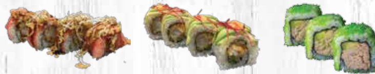
79. Red dragon 80. Green dragon 81. Spicy tuna