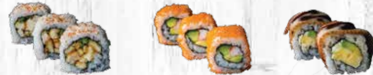
82. Crispy chicken 83. California 84. Unagi maki