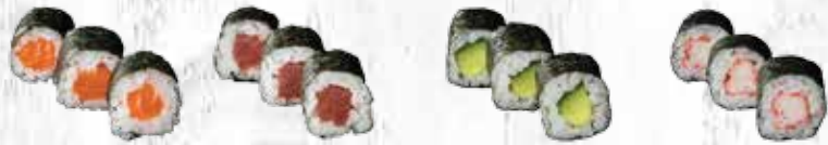
55. Zalm 56. Tonijn 57. Komkommer 58. Surimi